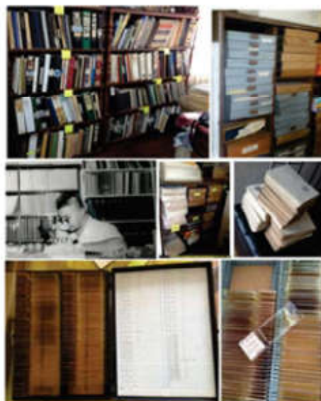
Figura 2 Recuperación del material bibliográfico y preparados palinológicos de colección «Elías Aliaga», incorporado al INGEMMET

De esta manera, tomando en consideración que aun teniendo los países de Europa y Norteamérica más de un siglo de permanentes investigaciones, los actuales esquemas bioestratigráficos requieren de más resolución para la exploración y producción de hidrocarburos (Cope, 1993). La exploración se ha movido hacia lugares más complejos donde la bioestratigrafía de alta resolución es fundamental, como por ejemplo en el direccionamiento de la perforación de pozos horizontales (Shep & Marshall, 1995). Bajo estas condiciones, la bioestratigrafía y el significado cronológico que ella proporciona, permite fechar y correlacionar las rocas a escala global, entre