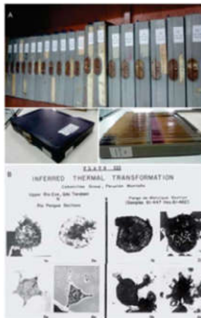
Figura 3 En 3A: Acondicionamiento, organización e inventario de material palinológico existente por sondeos. En 3B: Palinomorfos de la colección «Elías Aliaga» correspondientes al Grupo Cuzcoense en dos localidades pertenecientes a la Cuenca Madre de Dios.